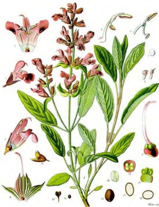
Salvia officinalis L.

Le foglie sono opposte, quelle inferiori hanno un lungo picciolo, le superiori molto breve, dal margine dentellato e la superficie bianco-tomentosa.